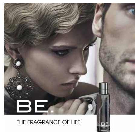
BE. THE FRAGRANCE OF LIFE